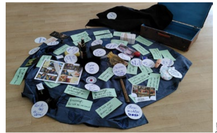
Prädikantenkurs P 23

Es ist aber auch notwendig, zu überlegen, was die reformatorische Theologie aktuell bedeutet. Dazu kann das Wort „protestantisch“ beitragen. Vier Aspekte des Protestantismus diskutierte der aktuelle Kurs: „Umgang mit Angst“, „Grenzen der Freiheit“, „Mut zum eigenen Weg“ und „Einstehen für-eintreten gegen“ (wörtl. Übersetzung des Wortes protestari). So ist der evangelische Glaube immer persönlich, an die Heilige Schrift, an das eigene Gewissen und die Überzeugung gebunden. Zugleich – aber auch immer politisch, auf eine Gemeinschaft bezogen.