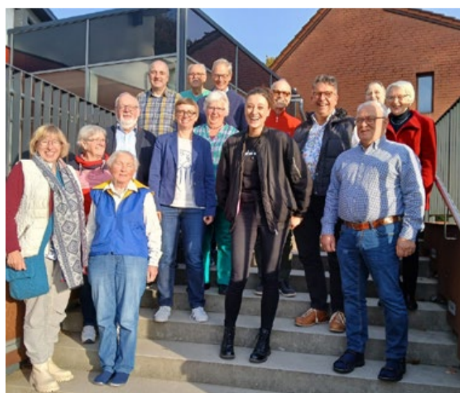
Dat weern wi in Beers

In 2025 giff dat wedder eene Rüstied mit een spannend Thema. ekert ja de Dage vun 26. – 28.9.2025. Wi dreepst us in Harmsborg (Hermannsburg).